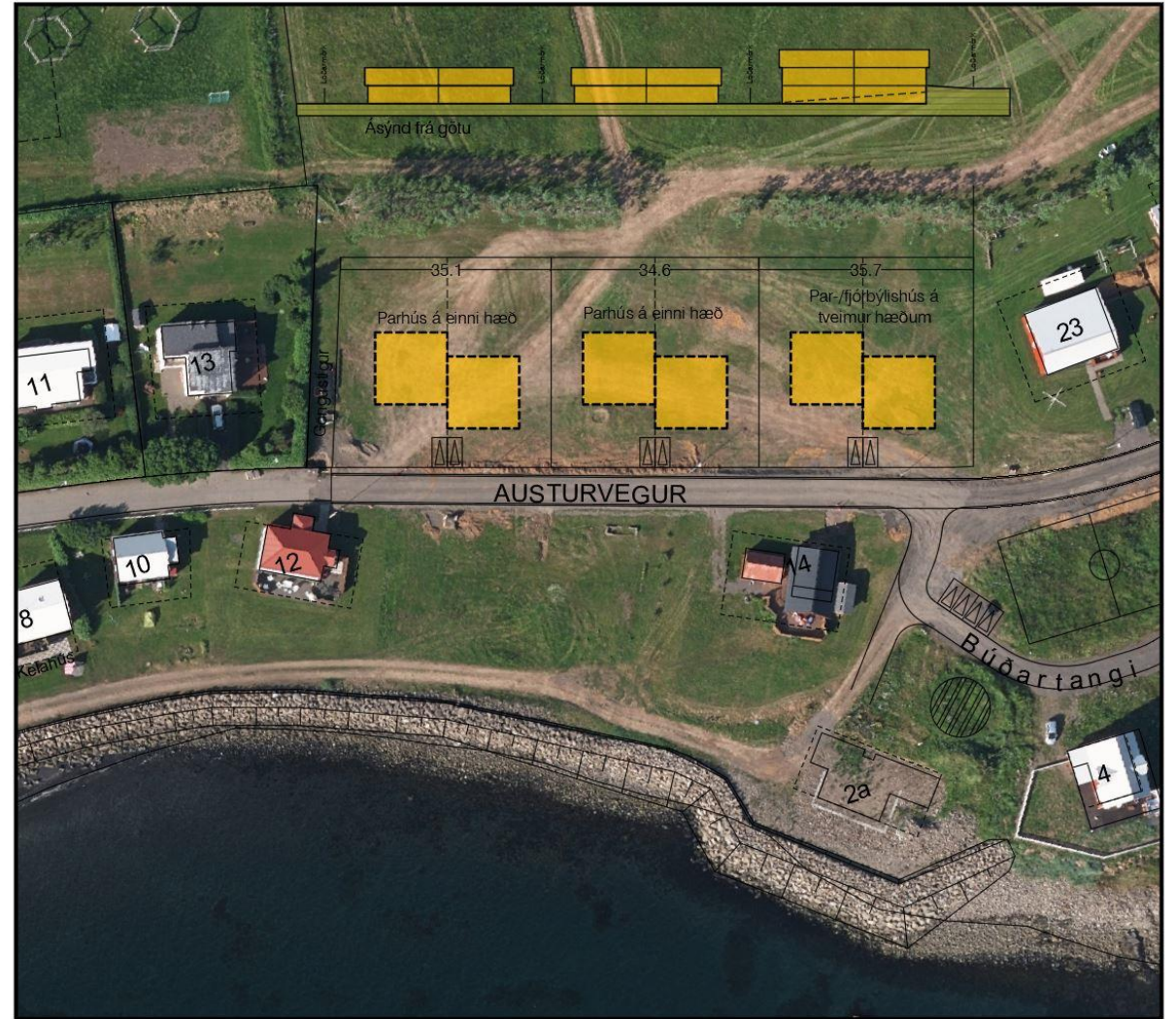
Austurvegur Hrísey – tillaga að breytingu á deiliskipulagi nr. 4