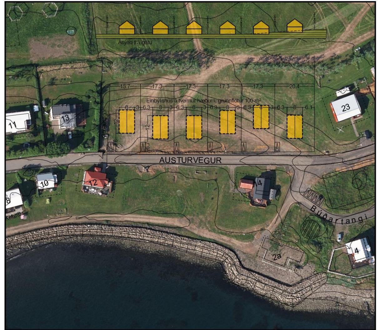
Austurvegur Hrísey – tillaga að breytingu á deiliskipulagi nr. 3